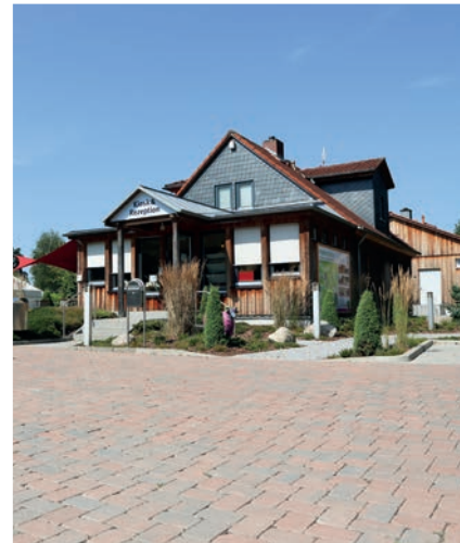
Startpunkt Campingpark Starting Point

town in the Hambühren municipality. Here you can have a look at the hydroelectric power station, which is the only one in northern Germany that has largely been preserved in its original state. From Oldau it goes along the Aller towards Südwinzen. On the way to the campsite, we recommend a detour to the Italian ice cream parlor Benincà.