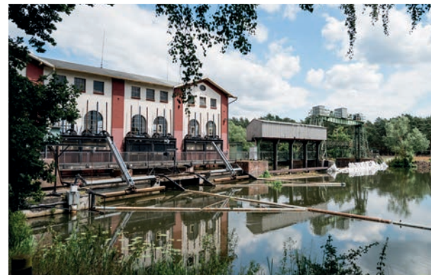
Wasserkraftwerk Oldau ± 5,6 km