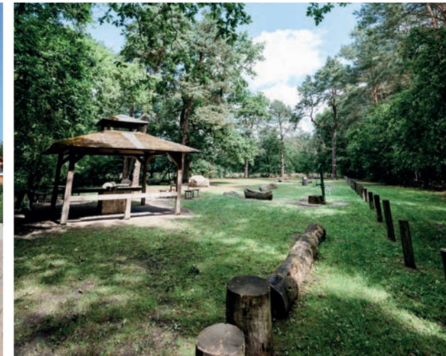
Wanderparkplatz Wolthausen Hiking car park ± 5,2 km